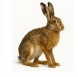
De Europese haas

Ree Het mannetje heeft een klein gewei, terwijl het vrouwtje geen gewei heeft. Reeën zijn veel kleiner dan edelherten. Ze worden vaak gezien op akkers en aan de randen van bossen.