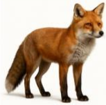
De rode vos

De rode vos is het meest verspreide wilde roofdier in Duitsland. Hij is zeer aanpasbaar en leeft in bossen, velden, steden en zelfs dorpen. Zijn vacht is meestal roodbruin, met een lichtere borst en een witpuntige staart. Rode vossen zijn alleseters en eten muizen, konijnen, vogels, insecten, fruit en afval.